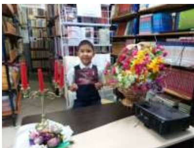
Самый маленький чтец ученик 1 класса занял 2 место.

Учащиеся 10-11 класса обсуждали книгу Василия Петрова «Вейли Озбар-исполнитель желаний» и в конце обсуждения подарили книгу в школьной библиотеке. Рекламировали для учащихся прочесть эту книгу.